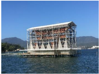
海上自衛隊呉基地/イメージ