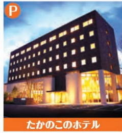
たかのこのホテル