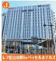
レフ松山市駅byベッセルホテルズ