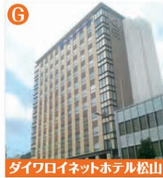
ダイワロイネットホテル松山