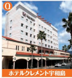
ホテルクレメント宇和島