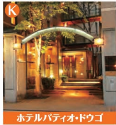
ホテルパーティオドゴ