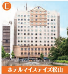
ホテルマイステイズ松山