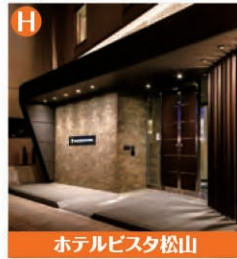
ホテルビスタ松山