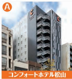
コンフォートホテル松山

■呉発／大人お一人様 旅行代金(シングル利用の場合) 17,200円～39,100円