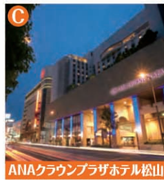
ANAクラウンプラザホテル松山