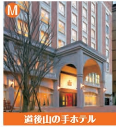
道後山の手ホテル