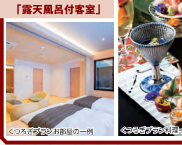
くつろぎプランお部屋の一部