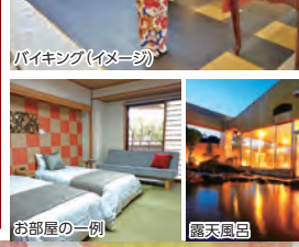
お部屋の一部 露天風呂