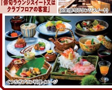
くつろぎプランの料理イメージ

くつろぎプラン 「併句ラウンジスイート又はクラブフロアの客室」 浴室(併句ラウンジスイート)