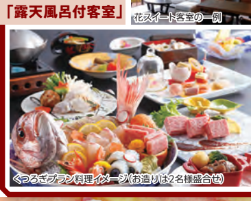
くつろぎプランの料理イメージ(お造りは2名様盛り合わせ)