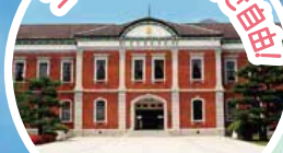
江田島旧海軍兵学校