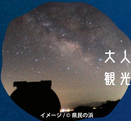
イメージ

大人も子供も楽しめる夏休み特別企画！ 観光型高速クルーザー『シースピカ』で ナイトクルーズにぞかけよう！