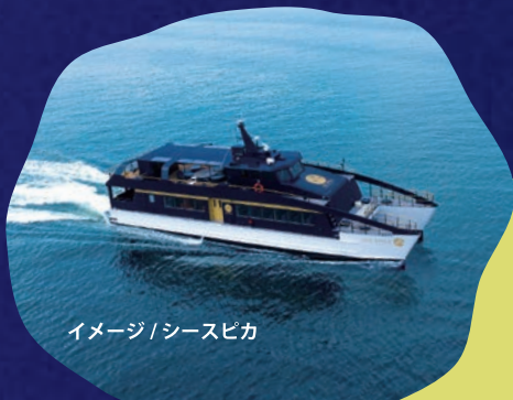
イメージ/シースピカ

■最少催行人員：50名 ■添乗員：同行いたします ■食事：夕食1回(※3歳～未就学児はお子様用の食事、0歳～2歳はお食事なし)