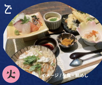
イメージ/夕食・鯛めし